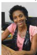
SÔNIA AP. DE PAULA DA SILVA

Localizado na Rua Mauro, 226. Atende crianças de 1 ano a 4 anos e 9 meses, de ambos os sexos, pertencentes às famílias, em sua maioria, moradoras do bairro, ou cujas mães e pais trabalham nas proximidades da creche, atingindo um total de 101 crianças.